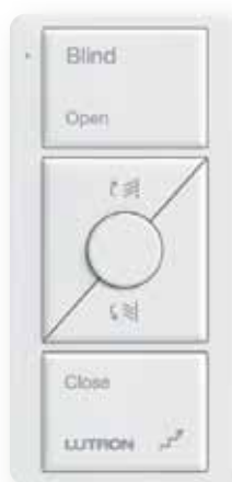
Commande sans fil Pico®

Disponibles pour : Sivoia QS, Sivoia QS wireless