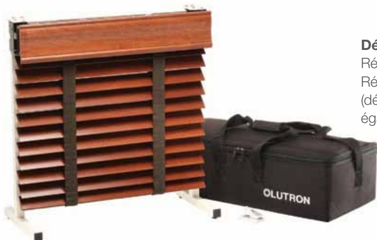
Démonstration stores vénitiens Réf. VENETIAN-DEMO-WD (illustrée) Réf. VENETIAN-DEMO-AL (démonstration aluminium également disponible)

Tous les supports marketing peuvent être commandés en utilisant l'outil Shade Configuration Tool (SCT). Des documents PDF sont également disponibles en ligne sur www.lutron.com dans la rubrique Service and Support.