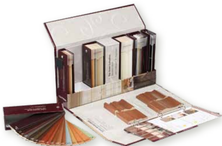
Classeur stores vénitiens Réf. VENETIAN-BINDER