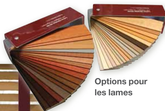
Options pour les lames

Les lames en bois dur et en aluminium font 50,8 mm (2 po.) de largeur.