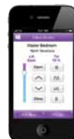
Home Control App pour iPad®, iPhone®, et iPod touch®