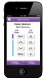
Home Control App für iPad®, iPhone® und iPod touch®