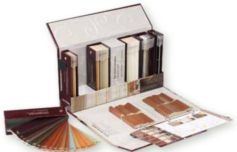
Jalousien-Mappe Art.-Nr.: VENETIAN-BINDER