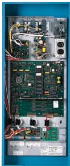
Grafik 6000 Processor Panel

解釋說。“我們可以從這些較大的PAR燈獲得細窄的光束，因此我們可以將燈安裝在我們需要其放置的地方。另外，所有表面都有一樣的燈光顏色，這是完全一樣的燈光。其結果非常漂亮”。