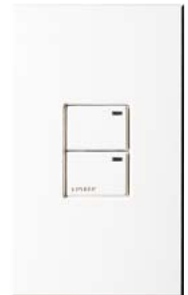
Architectural 2B Control

“路創提供了客戶支持、產品可靠性和強大的團隊努力”，庫格勒說。“我與他們有多年的合作經歷，我知道他們會飛過半個地球去幫助客戶的，而且他們這樣做過”。