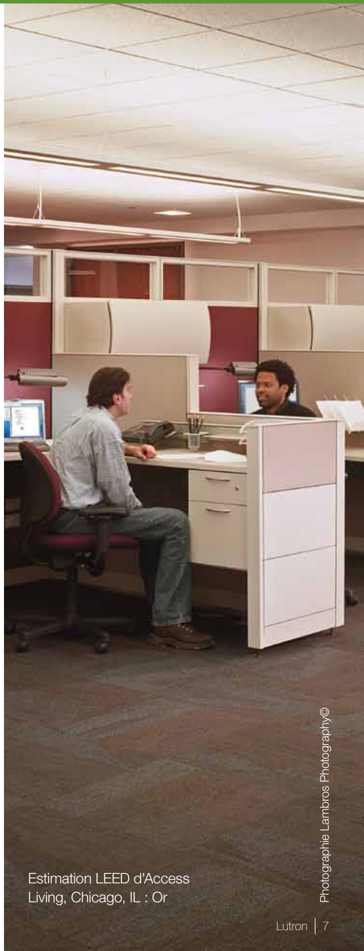
Estimation LEED d'Access Living, Chicago, IL : Or