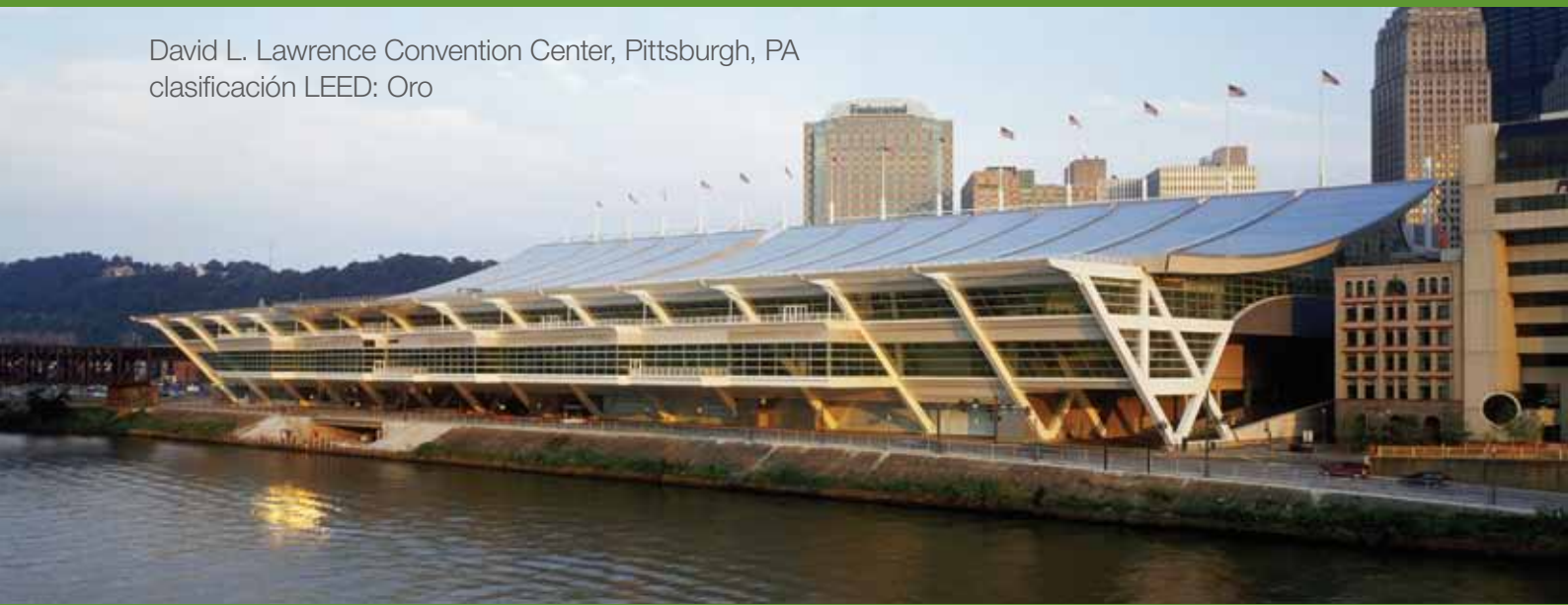
Fotografía © Roman Viñoly/Rafael Viñoly Architects PC

David L. Lawrence Convention Center, Pittsburgh, PA clasificación LEED: Oro