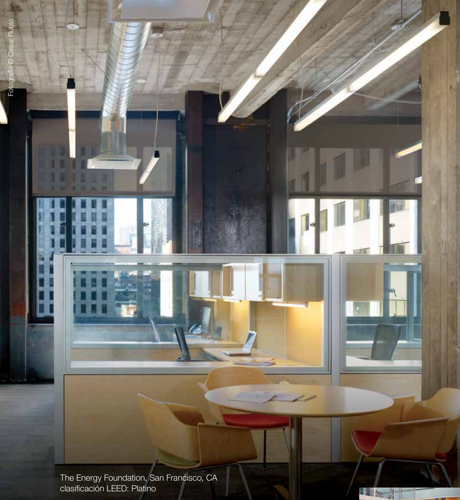
The Energy Foundation, San Francisco, CA clasificación LEED: Platino