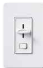
Skylark® C•L Colores brillantes