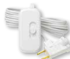
Credenza® C•L Negro (BL) Blanco (WH) & Marrón (BR)