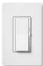
Diva® C•L Colores brillantes y Satin Colors