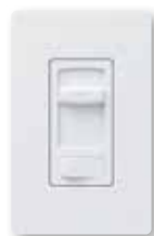
Skylark Contour® C•L Colores brillantes