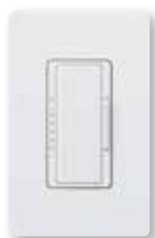
Maestro® C•L Colores brillantes y Satin Colors®

Disponible en una variedad de estilos estéticos y colores para adecuarse a cualquier decoración