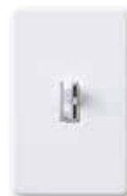
Ariadni® C•L Colores brillantes (excluyendo gris)