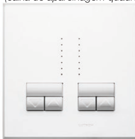
Rania duplos (caixa de aparelhagem quadrada)