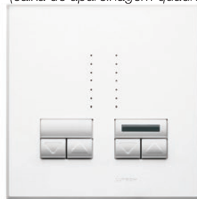
Rania duplos de infravermelhos (caixa de aparelhagem quadrada)