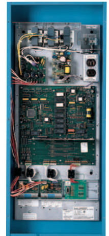
Grafik 5000 Processor Panel

deren Lebensdauer auf das Doppelte die Legoland-Techniker brauchen die Birnen nur halb so oft auszu-tauschen und senken so den Instandhaltungsaufwand.