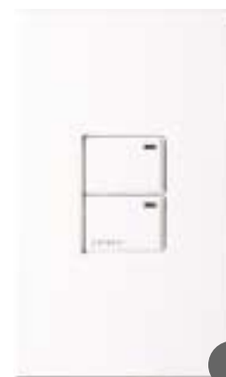
Architectural 2B Control

"Lutron bietet Unterstützung, Zuverlässigkeit und eine große Teamleistung", erklärt Kugler. "Ich arbeite seit Jahren mit dieser Firma zusammen und wusste, dass ein Kunde am anderen Ende der Welt gleichermaßen gut bedient wird. Und so war es auch."